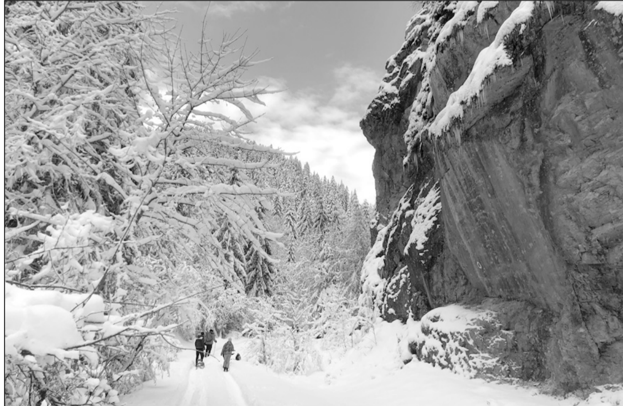
A vízeséshez közeledve sziklaóriások magasodtak fölénk, a fák ágaira vastag hó telepedett

gyaszottuk, visszaereszkedtünk a nyeregbe, majd a piros pötty jelzésen haladtunk tovább, amíg el nem értük azt az elágazást, ahol az eredeti terv szerint fel kellett volna térnünk a kék pöttyön. Mivel lassan már két óra késésben voltunk és a csapat néhány tagjának vészesen csökkent az energiaszintje, túravezetőnk úgy döntött, hogy lerövidítjük az útvonalat és a gerincen haladva visszaereszkedünk Havasrekettyére. Az ambiciózus, öttagú csapat viszont ragaszkodott az eredeti tervhez, így szétváltunk és ők elindultak a kék pötty jelzésen. Mi újabb ebédszünetet iktattunk be, közben pedig a nap meleg sugaraiban fürdőztünk, de voltak, akik hóembert is építettek. Tovább indulva folyamatos eresz-