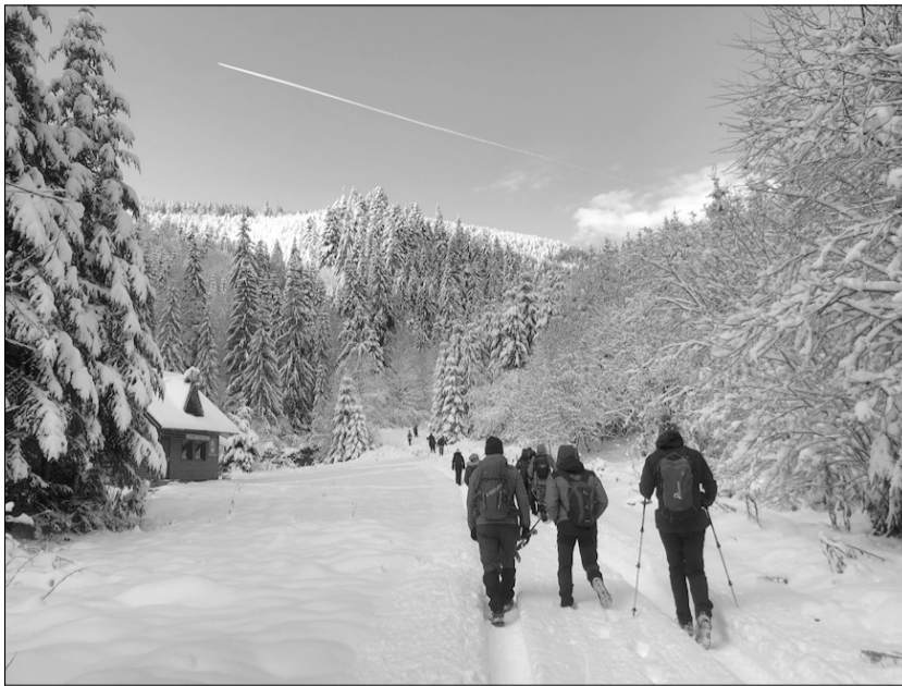
A hófedte táj és az ég kékje ámulatba ejtette csapatunkat