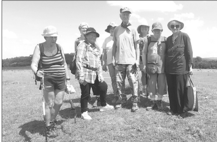
Csoportkép a Csiga-dombon

részeken. Elindultunk lefelé a völgyön. A patak a Mikesi-tóba ömlik, akárcsak a Hosszú-patak (Varaticelor), táplálva a Mikesi tavat. A völgy elég hosszú, nem volt értelme lefelé menni a térdig érő vizes fűben, kimásztunk baloldalt az erdő fái között és ráálltunk egy szekerútra, amely a két patak közötti gerincen kivezetett az Árpád-csúcs felé haladó útra.