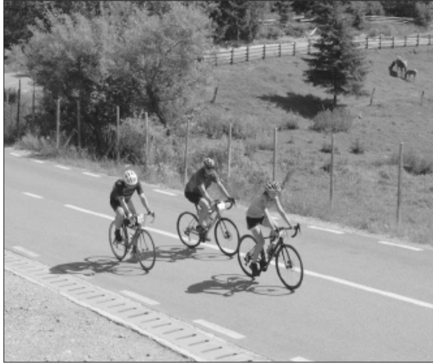
A meleg és az emelkedő sem szeghette a résztvevők jó kedvét

A Meleg-Szamos völgyén felfelé haladva olyan kellemes hűvös levegő fogadta a bringásokat, hogy szinte fáztak, ám amikor maguk mögött hagyták a fák oltalmazó árnyékát, egyre izasztóbbá vált a helyzet. A leggyorsabb bringás annyira meg szeretne volna