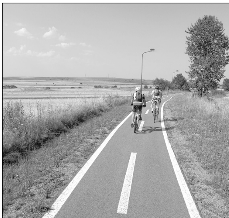
A kalotaszentkirályi bicikliút

Kétségtelen, számomra ez volt az eddigi legvagányabb, legvidámabb, legkalandosabb és az extrém hőmérséklet miatt a legnehezebb Vasvári. Köszönöm szépen a szervezőknek!