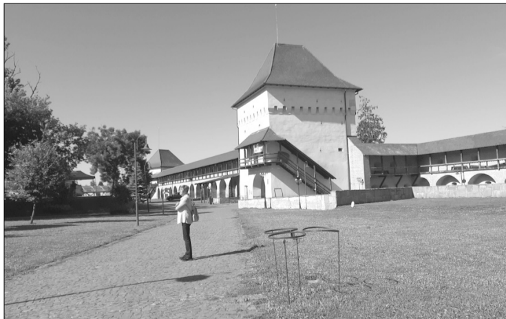
A marosvásárhelyi vár

Elindultunk az Árpád-csúcs alatt haladó úton. Délnyugatra a Mikes-patak völgyébe próbáltunk beereszkedni. Régen a nyírfák között egy meredek völgyön ereszkedtünk le, eljutottunk egy útig (ez régen nem volt itt, talán levezet a völgybe, gondoltuk), de az eső áztatta homokos talajba belesüppedt a lábunk. Megpróbáltuk megkeresni a régi lejárót, látszottak valami régi nyomok, de mindent benőtt az elvadult növényzet, és a lezúdult esőtől minden vizes volt. Leértünk lassan a völgybe a meredek oldalon, átgázolva a sűrű növényzetben, de a tisztáson, ahol régen jártunk, már évek óta nem legeltettek állatokat, térdre felül ért a fű. Közben a felhők széteszlottak, ismét kissütött a nap. Míg elővetünk útravalónkat, ruháink megszáradtak a napon, kivéve a cipőket, amelyekben locsogott a víz. Szép volt valamikor ez a völgy, le volt kaszálva a fű, a patak kacskaringózott a völgyben, le lehetett menni egészen a Mikesi-tóig. Most a patak sem látszott, csak a partját szegélyező bokrok jeleztek, hogy ott van, de a bokrok is megnőttek az eltelt évek alatt. A patak jobb partján volt az itató az állatoknak, az erdő fái között a forrás szintén a jobb paron. Most nem voltak utak, ösvények, talán senki nem járt erre évek óta. Az esőtől vizes, térdre felül érő fűben lehetetlen volt átnézni a tisztást és környékét, az oldalról lefolyt esővíztől sok helyen bokráig ért a víz a füves