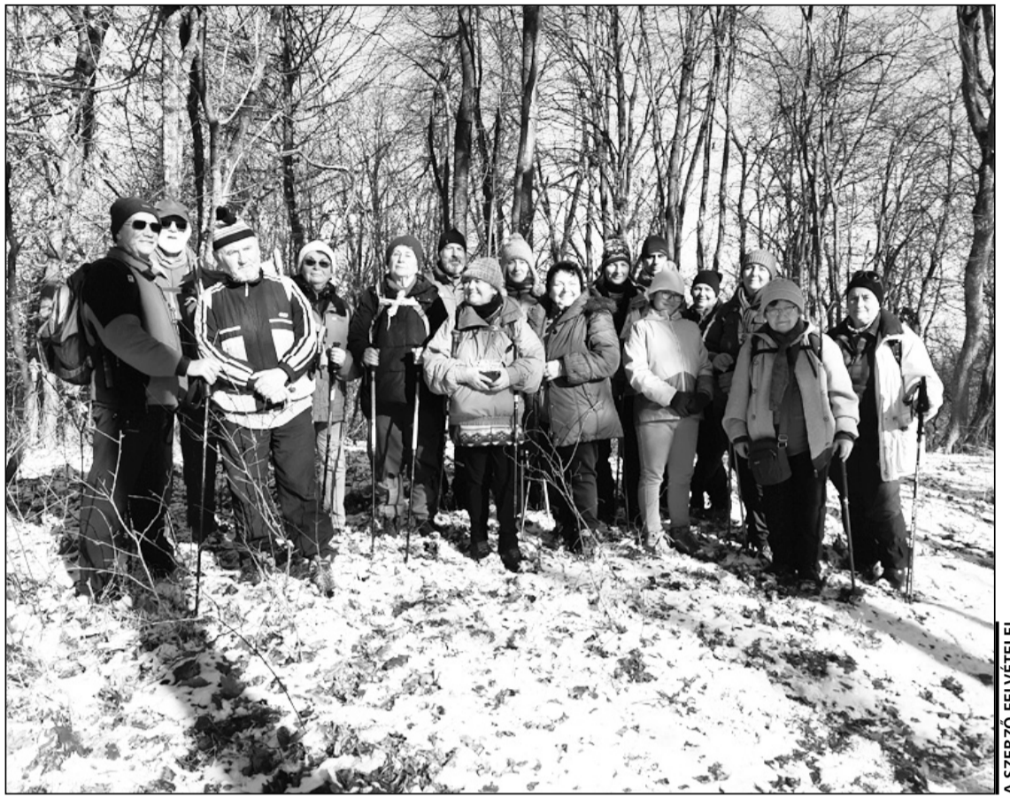
Az elmaradhatatlan csoportkép a Bükk-tetőn

Január 13-án a szászfenesi Csiga-dombra indultunk alkalmi kirándulásra, újabb útvonalat próbáltunk ki. Kisbátság a 31-es autóbusszal utaztunk, onnan a megszokott úton átvágtunk a szucsági legelőn a Bongár-forrás feletti nyereghez. A talaj kicsit fagyos volt, vékony réteg zúzmara takarta a legelőt, ez megkímélte a sárgadagasztást. A Muzsda-erdőn vágtunk keresztül, majd balra fordultunk, míg kiértünk a legelőre, amelynek kiemelkedő pontja a Csiga-domb (615 m). Mivel az idő felhős, a levegő párás volt, a kilátás elmosódott a Gyalui-havasok és a Kis-Szamos völgye felé. A Csiga-dombról Szászfenésre akartunk leereszkedni, de a meredek oldal ebben az időben csúszós volt, így a magassági pont mellett haladó ösvényen indultunk nyugati irányba. A kőd kissé szertefoszlott, majd jobb kéz felé, lent a völgyben, a napsugarak megvilágították Szucság házait és a település templomát. Ezen a völgyön be lehet ereszkedni Szucságra, a távolság körülbelül 3 km, de most nem ez volt az úti célunk. Továbbmentünk a gerincen a Bagolsúrútnak nevezett erdőcske felé, az út továbbhaladt a Bátor-hegy irányába (ez a Kós Károly-teljesítmény-