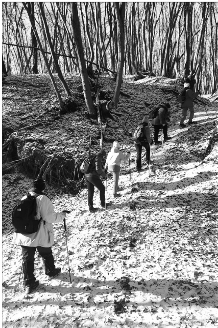
Csapatunk a Bükk-tető felé menetel

A legelterjedtebb néphagyomány szerint, ha a téli álmából ébredő medve barlangjából kijőve február 2-án napos időt talál, megijed az árnyékától, és visszabújik a vackába, mert a korai, csilóka napfényt azt jelzi, hogy a tél még nem tőmlött ki magát, a zord idők java még hátravan. De ha borús felhők takarják az eget, a medvének azt jelenti, hogy már lassan vége a télnek. Az idén február 2-án borús volt az idő, de enyhe, a Feleki-gerincet vékony réteg hó borította. Reméljük, hogy a medve nem ment vissza a barlangjába, és ha enyhe is volt ez a tél, reméljük, hamar eljön a tavasz.