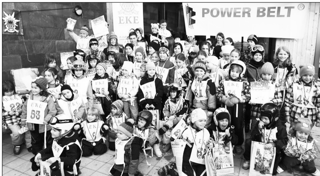
A X. borszáki EKE-gyereksíverseny résztvevői már jócskán felcseperedtek

– Az egyik legkedvesebb emlékem talán az egyik kislány véleménye, aki szerint ez a síverseny Kolozsvár magyarságának olyan télen, mint a Kolozsvári Magyar Napok nyáron. Ez nekünk a legnagyobb dicséret. Elmondhatjuk, hogy lassan egy generáció nőtt fel ezen a versenyen, az első kis versenyzők lassan már saját gyerekeikért izgulhatnak a rajtban. Annak is örülök, hogy a gyerekek visszajárnak a versenyre, még akkor is, ha nem érnek el dobogós helyezést, és ez igazol bennünket, hiszen nem a győzelem, hanem a részvétel a fontos.