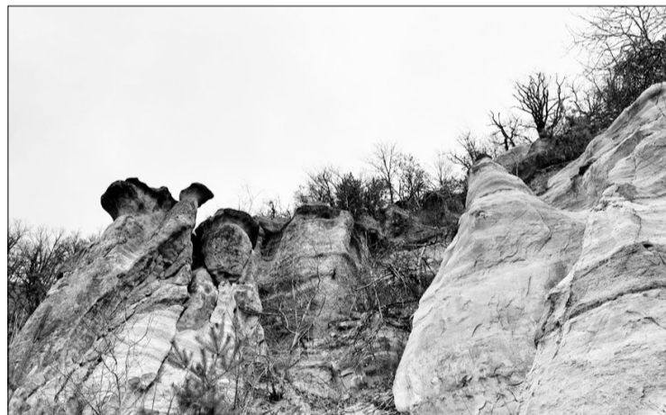
Első pillantásra azt gondolhatnánk, hogy a Sárkányok kertjében lévő sziklaalakzatokat látjuk

■ Az a tény, hogy számotokra kevésbé ismert Dank, Ferencbánya, Forgácskút, nem gond. Mit mond nektek Csonkatelep vagy Máriatelep? Gyertek a túráinkra, s gazdagodni fog tudástáratok.