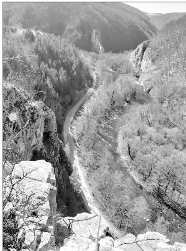
Kilátás a Vársonkolyosi-szorosra

A barlang első írásos említése 1839-ből származik, feltárásával már dr. Balogh Ernő foglalkozott 1938-tól kezdődően. 1950-ben rendszeres kutatáshoz és feltérképezéshez látott. 1979–1984 között a balázsfalvi Polaris barlangászklub térképezte fel, és kiépítették a bejárat szakaszt. Később fából készült, korláttal ellátott járda is volt a barlangszáj mellett, de elmosták az árvizek, így csak vízben gázolva juthatunk a barlangszájig, amely 4 m széles, 35 m magas, kissé ferde, hatalmas gótikus kapura emlékeztet. A Szolcsvai-búvópatak barlangjában gazdag cseppkőalakzatok láthatók, itt él Európa legnagyobb denevérpopulációja. A barlang látogatása tilos és veszélyes, csak gyakorlott barlangászok mehetnek be megfelelő felszereléssel. Innen hirtelen emelkedőn, gyalogösvényen jutottunk a nyeregbe, csodálatos kilátás nyílt az Öreg-havas hóborította gerincére, látszott a Bélavár, a Vultureasa és a Vulturese szikláit, kicsit távolabb a Zsidovina.