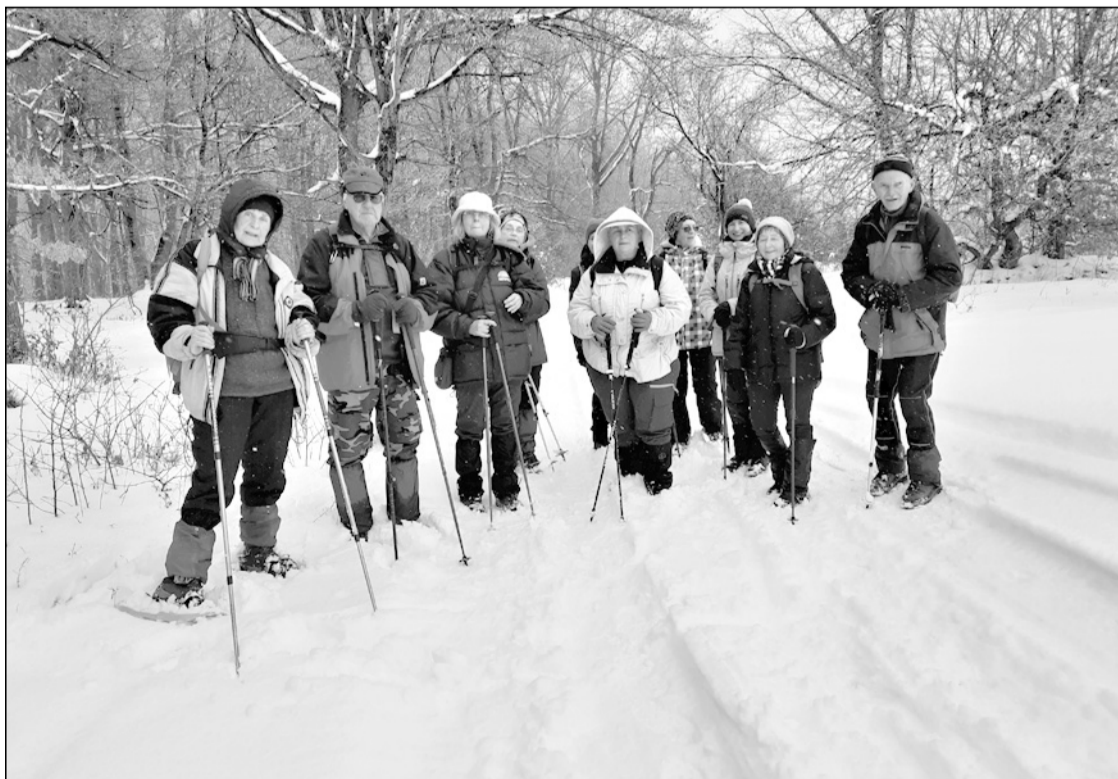
A letérőnél a Majláth-kút felé

A havas, télies idő ellenére (vagy éppen annak köszönhetően) sokkal több kirándulóval talákoztunk, mint máskor, a Péter-gerincen több helyen is gyermekek és felnőttek hóembereket formáltak a friss hóban. Hétfőtől a hó aztán elhozta a téllal együtt a dermesztő hideget is, a következő napokban a hőmérséklet -10\text{ }^{\circ}\text{C} alá csökkent.