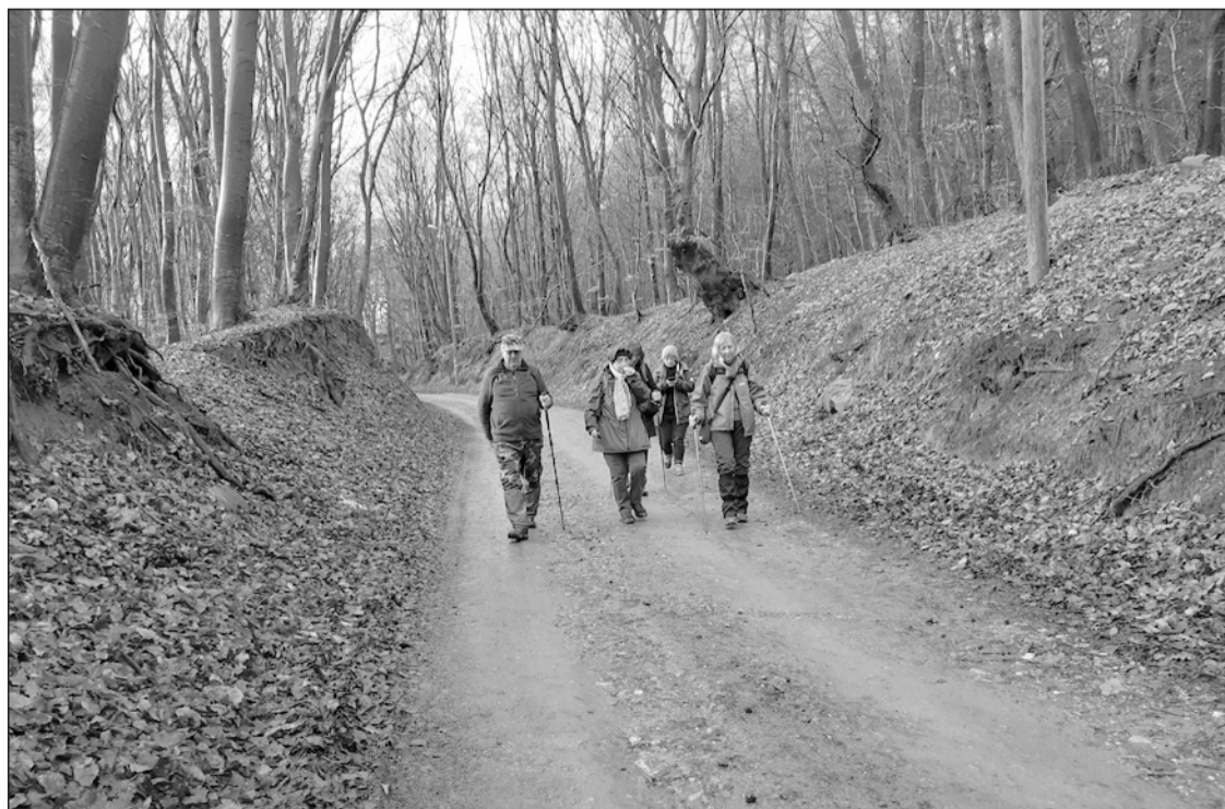
Hazafelé a Mikes-gerincről