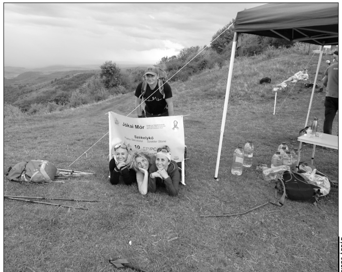
Jókedv a Székelykőn, a Jókai-túra legmagasabb pontján

A nagy ünnepi készülődésben néha meg is feledkezünk arról, mi minden történt az elmúlt esztendőben. Érdemes egy pillanatra lelassulnunk, visszatéknünk és mérleget vonnunk 2022 történéseiről. A kolozsvári EKE-ben 2022 mindenképp a rekordok évének tekinthető, így hálás szívvel készülünk magunk mögött hagyni az óévet, és reménységgel indulunk az újév felé.