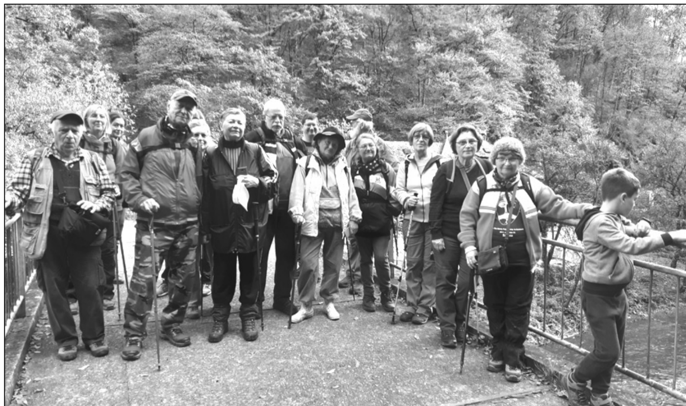
Csoportkép a Révi-szorosban

Visszatértünk a csillagvizsgáló felé, a Mikesi házak (Kászoly) irányába folytattuk utunkat, és a Sárosbükön át vezető, piros sávval jelzett ösvényen ereszkedtünk a Bükki házakig. Ezen a részen még fotózhattunk feleki gömbköveket, de számuk itt is egyre apad. A piros jelzésen továbbhaladtunk a Páter-úton a Diósig, onnan a Monostor lakónegyedig. A túrán 33-an vettünk részt és 15 km-t tettünk meg. Csodálatosan szép őszi nap volt, másnapra már lehűlt a levegő, köd ereszkedett le, a következő napokra esőt, majd havazást jeleznek a meteorológusok.