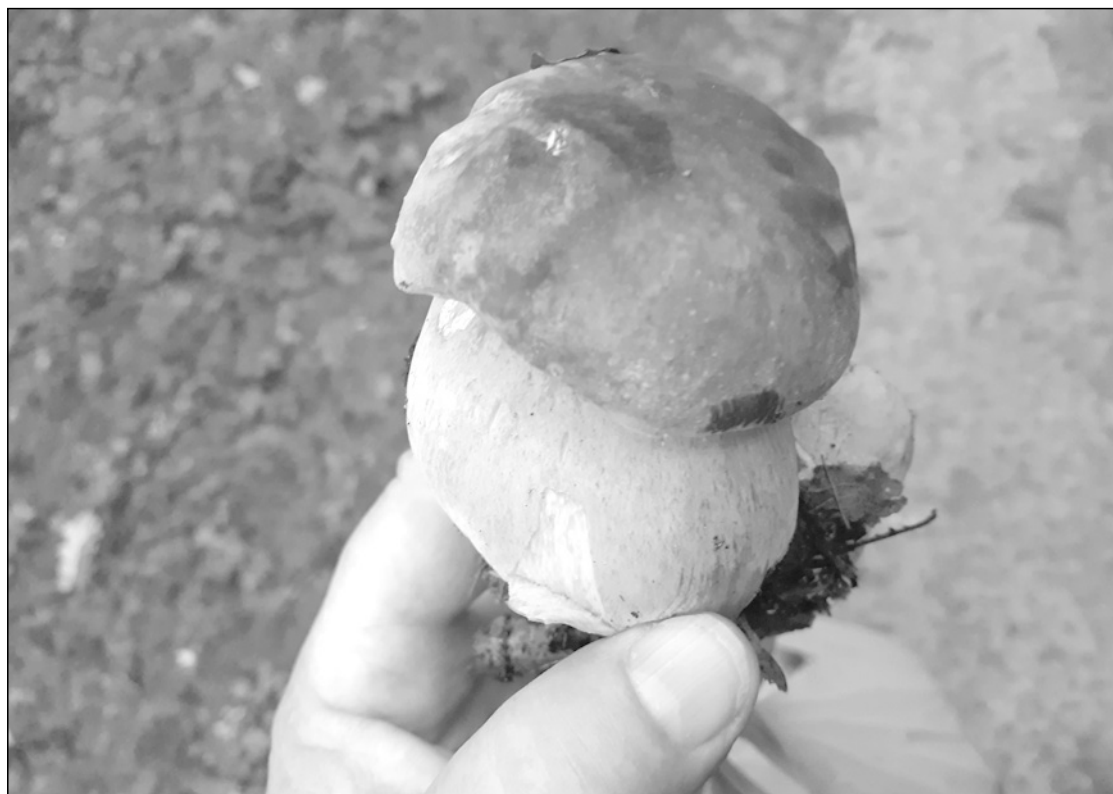
A zsírosan fénylő, gesztenyebarna, ízletes vargánya vagy hiriba

A következő szombaton, szeptember 9-én a Bácsi-torokban és a Hója-erdőben gombásztunk, indulás után eleredt egy zápor, de amikor leszálltunk a 31-es autóbusszról, el is állt, eleinte felhős volt az ég, később a nap is előbújt és át-szűrődtek sugarai az erdő lombjai között. Az erdőn keresztül a Hója gerinc felé vettük az irányt, erre is sok volt a gomba, a Kányafő úton ereszkedtünk le a Donát negyedbe megcsodálva a szép kilátást a Kis-Szamos völgye és a város felé.