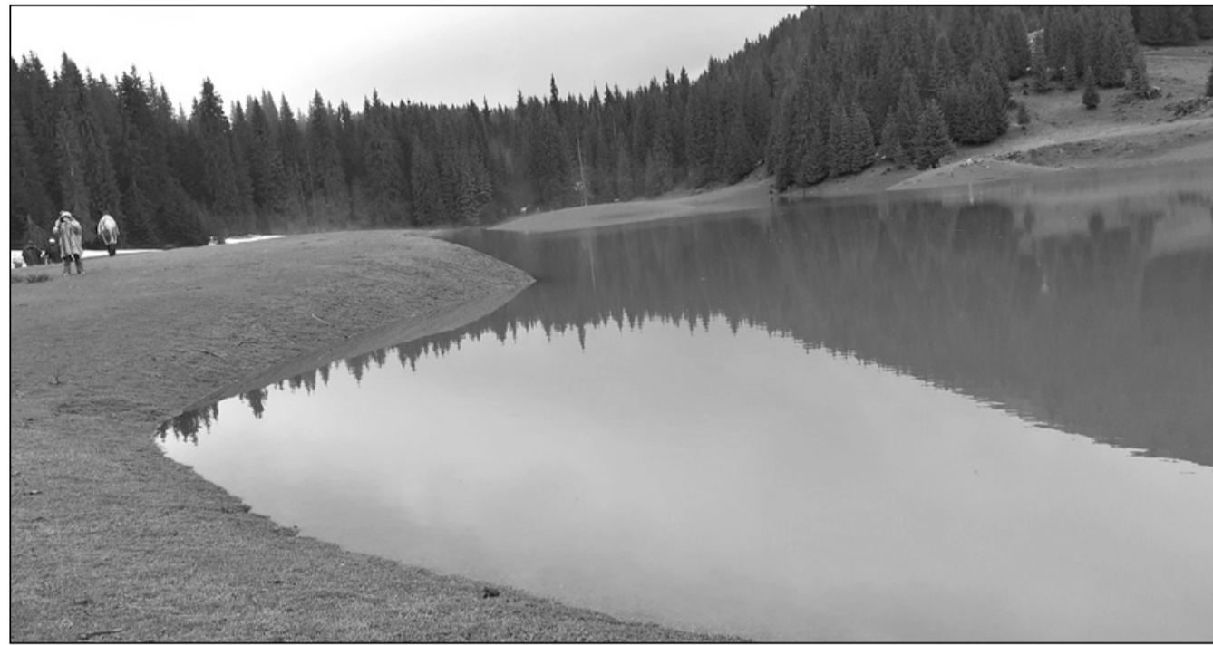
Tavaszi tó a Ponor-réten

A Pádis-menedékháztól a Ponorréten át, a Glavojon keresztül a Scărița-erdészházig gyalogolunk, ez úgy 9-10 km. Hosszabb túra nem fér bele az időbe. A Pádis-fennsík központi részén összegyűlt csapadék és olvadákvíz a zombolyokon keresztül a felszín alá kerül. A víztömeg nagy része a Ponor-rét közelé-