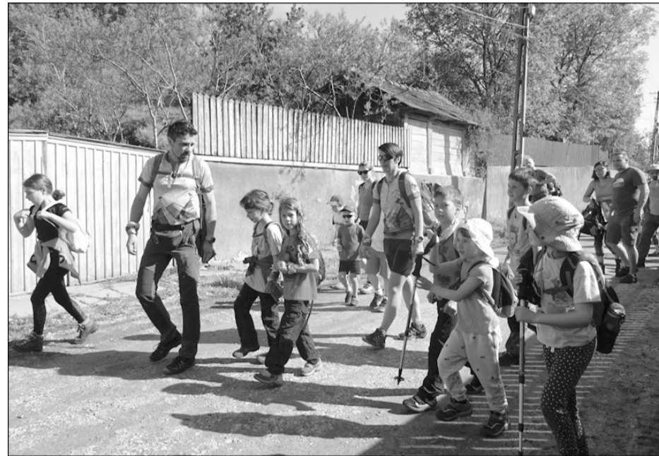
Gyerekcsoport indul Várfalváról