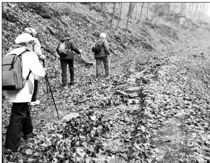
Indulunk a magaslaki Zichy-kastélyhoz

kedik a fák közé, már egymást is alig látjuk. Az elágazásnál nehezen találjuk meg a jelzést, valószínűleg kivágtak fákat a jelzéssel együtt. A nedves idő miatt csúszós és sáros az út felfelé, amikor pedig a kastélyhoz érünk, elered az eső. Az autóbuzosig hátralevő 8 km-t havas esőben tesszük meg, de azért sikerül medvehagymát is gyűjtögetni. Szép az erdőben vezető út még így ködben, esőben is, magas, sudár fák mindkét oldalon, sok a hóvirág. Elázva érünk az autóbuzoshoz, amely a hármas elágazásnál vár ránk az Élesd felé vezető úton. Szerencsére a buszban meleg van, Kolozsvárig megszáradnak a nedves holmik. Izgalmas, élménydús kirándulás volt, sajnáljuk, hogy a rossz idő miatt nem láthattuk ezt a csodálatos vidéket igazi szépségében.