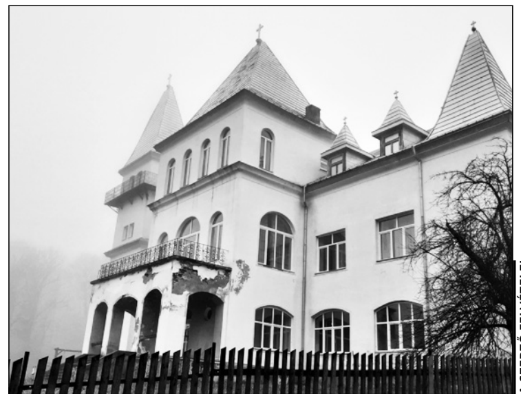
A kastély nem látogatható