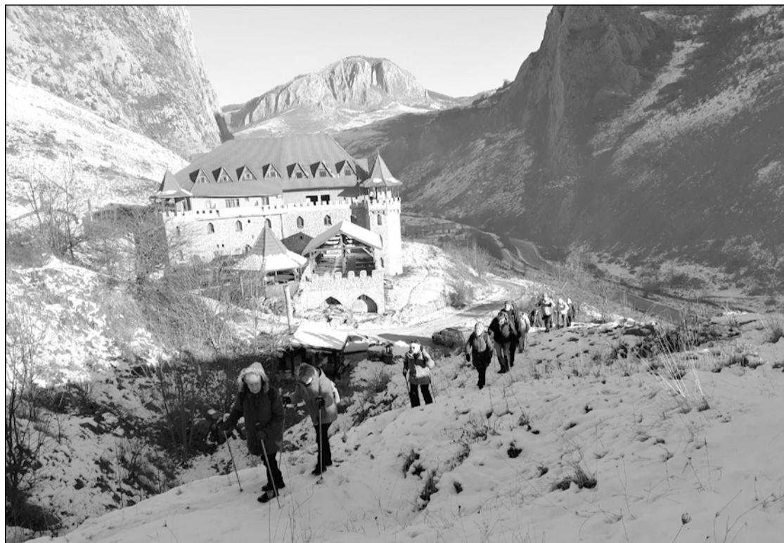
A Kőközi-szoros robusztus sziklafalai között, háttérben a szállodával

m Rachiș-csúcsot látjuk. Nyugat felé mély völgyek szabdalta erdős hegyoldalak, az Inzel-, a Drăgoiu- és a Bedellő-patak völgye, ezeken a völgyeken el lehet jutni a Remetei-sziklaszoros felé haladó gerincútra, vagy akár a Butan-kő (1052 m) kettős csú-