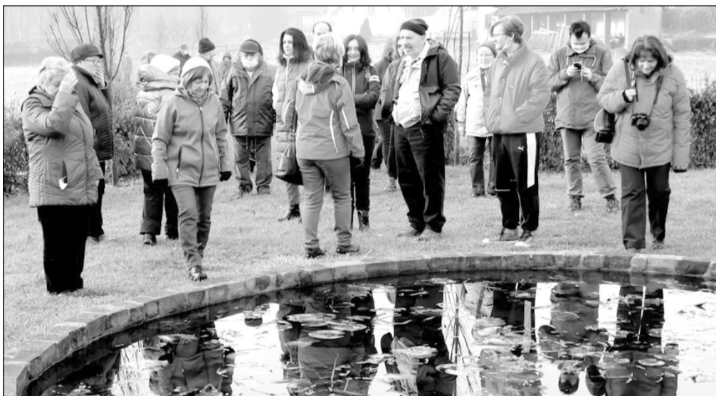
A soborsini királyi kastély kertjében

Különleges építmény Demsus kősisakos Szent Miklós-temploma. A keletkezésére vonatkozó legelfogadottabb elmélet szerint a 2. században épült Longinus Maximus római katonai vezető síremlékeként. Ezt alakították jóval később, a 13. században templommá, majd a 15. században freskókkal díszítették. Egykor reformátusok és ortodoxok közösen használták, ma az ortodoxoké. Zeykfalva kősisakos temploma is a 13. században épült, román kori és gótikus elemeket tartalmaz. Eredetileg katolikusnak épült, falait kívül és belül is különlegesen szép freskók díszítik, zömmel a 15. századból származnak. A nagy felületen megmaradt belső freskók apostolokat, szenteket ábrázolnak. Külső festéséből viszonylag kevés maradt meg a keleti, déli falon és a kapuzat lunettájában. Déli oldalához a Zeyk család 1724-ben református templomot építtetett, amelynek a latin nyelvű alapító feliratát tartalmazó követ a templom északi oldalának támasztva mi is láttuk. Magyar hívei hamarosan elfogytak, a templom az ortodoxok birtokába került, de ritkán használják, mert van a faluban is ortodox templom, ezért maradhatott meg szinte eredeti alakjában.