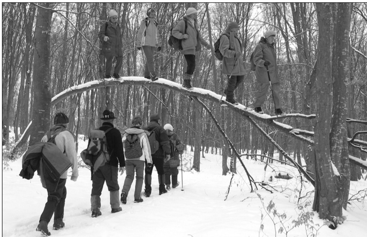
Felüljáró a Bükkben (Bozsoki Adrienn, montázs)

Elhallgatunk, a troli elhagyja a Kétágú templomot. A megállóban felszállt gyermek tangóharmonikája kántálásra jajdul: Déscsidé usá, krestinyéé! (nyisd az ajtót, keresztényee). És láss csodát, fék csikorog, kivágódnak az ajtók. A sofőr vigyorg: – Te akartad, le veled! A megszeppent harmonikás még segélykérően körbenéz, de aztán jobbnak látja, ha leszáll, az utasok szenttelen tekintetétől kísérvé.