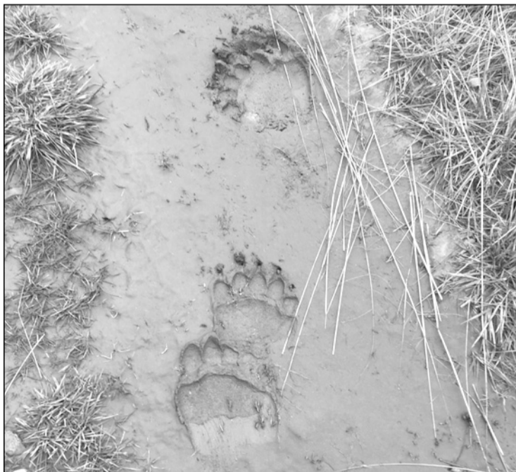
Ma már csak jó sztori a friss medvenyom