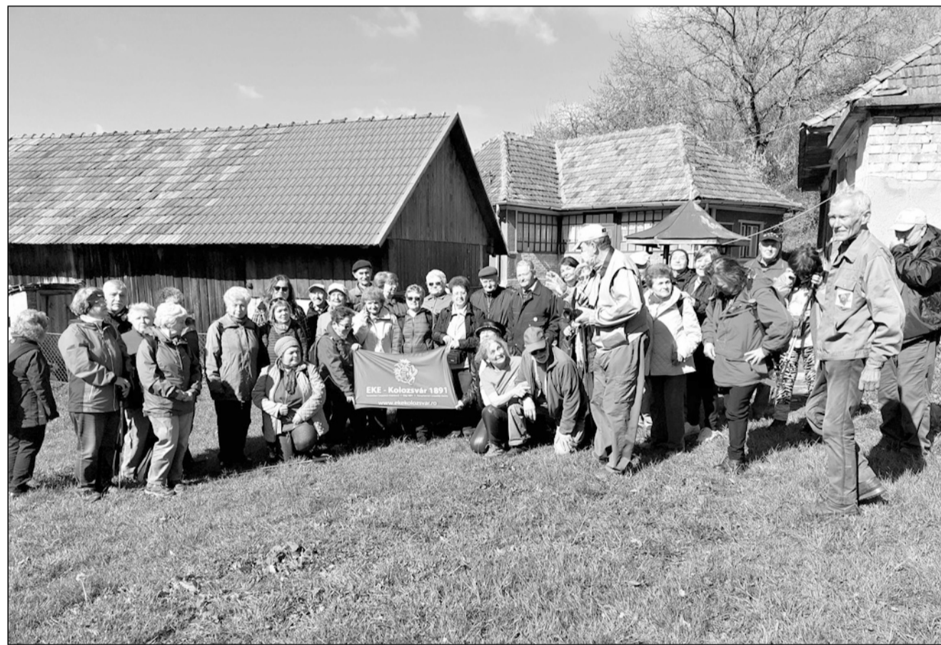
Születésnapot ünnepeltünk: 130 éves az EKE

névű dombon. Arra fordulunk, nem sokára elérjük a gerincen levő házakat, a telkeken sok a gyümölcsfa. A gerincről egyre szebb a táj, most már Csucsára is rálátunk. Alattunk meredek oldal, ahol néhány évvel ezelőtt egy heves vihar kidöntötte a fákat. Romos házhoz érünk, innen még egy kis emelkedő, és a tetőn vagyunk. A Híres- vagy Hárşu-tető (684 m) nem tartozik a legmagasabb csúcsok közé, de tiszta időben a körpanoráma csodálatos. Alattunk Csucsá és a Sebes-Körös völgye, azon túl a Vlegyásza előhegyei, mögöttük a Vlegyásza 1836 m-es gerince még mindig fehér a hótól, tőle délnyugatra a Királyerdő hegység. A Sebes-Körös jobb oldalán a Réz-hegység lapos tetői és hegyháti sorakoznak, legmagasabb csúcsai a Magura (918 m), az Almácska-tető (882), a Cornu-csúcs (903 m) és a Ponor-csúcs (801 m). Azon túl a Berettyó forrásvidéke és a szilágysági dombvidék következik. A Réz-hegységet kelet felől a Meszes-hegységtől a 669 méter magaságú Plopis-hágó választja el Csucsá és Perje között. Jól látszik a Meszes-hegység legmagasabb csúcsa, a Perjei Magura (996 m). A tetőn megkeresünk a magassági pontot, és csúcsfotót készítünk. Ebédszünetet a romos ház-