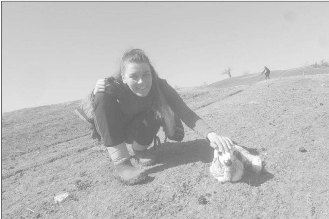
A leányvári túrán néhány napos kisbárányt szelídítettünk meg