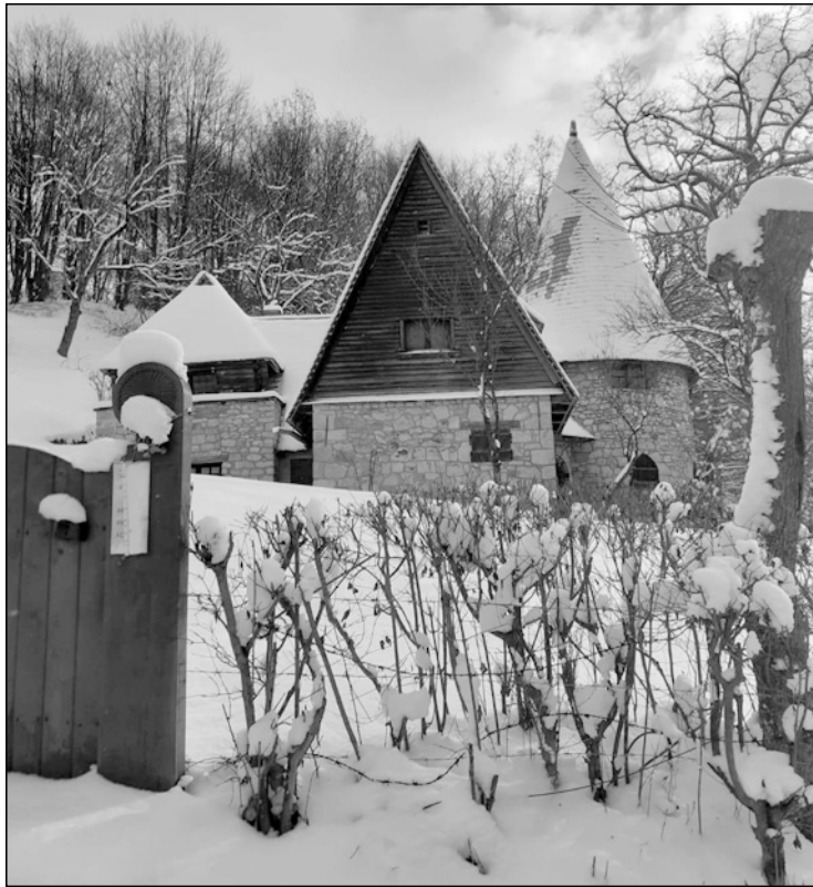
Varjúvár igazi télben

Sztána, Kalotaszeg legkisebb települése, ma már alig több mint hatvan lakosával a nyugalom szigete. Valószínűleg ezért szeretett bele Kós Károly is, és építette fel a vasútállomás közeli nyaralótelepre az eredetileg hétvégi háznak szánt Varjúvárat a múlt század elején. Csakhogy a történelem kezeke nagyot fordult, a nyaralóból állandó lakhelye lett a Budapestről hazaköltözött családnak. A Varjúvár közelében áll a mai telep legnagyobb épülete, a szintén Kós által tervezett Szentimrei-villa. A faluból viszatérőben ezeket is meglátogattuk. Ettől feljebb, a Csigadomb oldalán építette Kós Károly az 1920-as években a Varjú-tanyát, amelyet alkotóhelyként használt. 1944 októberében a környékbeliek módszeresen kifosztották a nyaralótelepet, ekkor pusztult el a Varjú-tanya is.