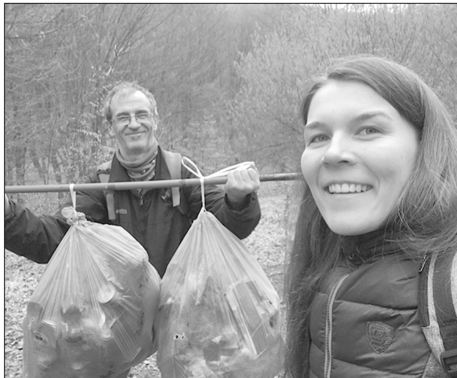
A bokrokba szorult szemeteket legközelebb!