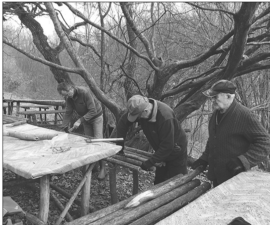
Új lábak készültek a padokhoz