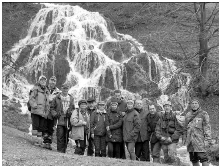
2013 áprilisában a Berettyó-forrásnál

Mindannyian elmondhatjuk, akik ismertük, hogy szerencsések vagyunk, amiért kortársai lehettünk, vele túrázhattunk sok-sok éven át, hónapról hónapra, hétről hétre. Nyugodj békében, pihenésed legyen csendes.