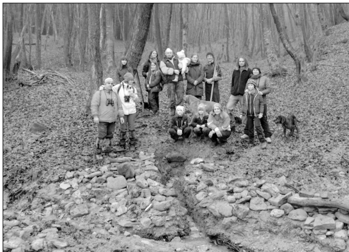
A megtisztított forrásnál