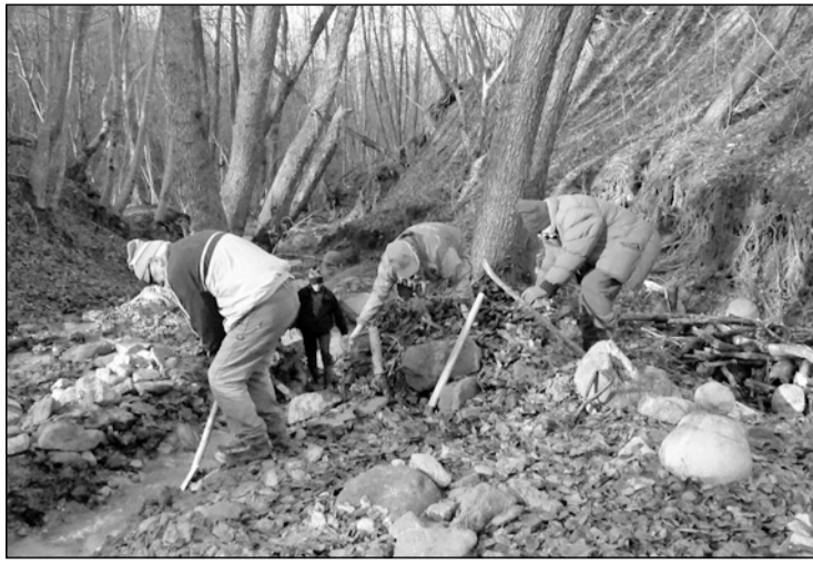
Szélesítjük és bővítjük a patakmedret