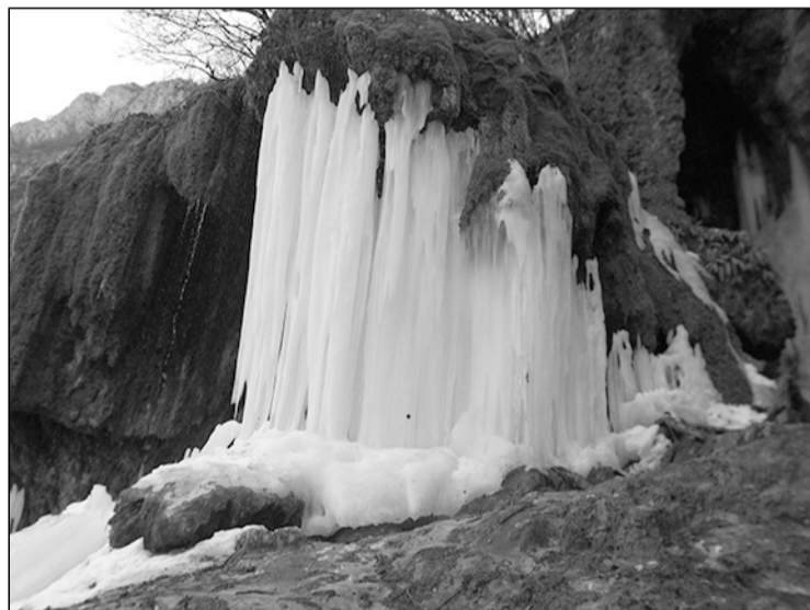
A Šipote-vízesés felső része, ahogy láttuk