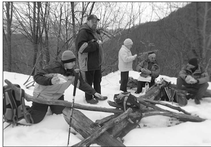
Pihenő a vízesés feletti tisztáson

Visszajutni a jeges ösvényen nem volt könnyebb, mint lemenni, de a piros kereszt jelzésen, egy elég széles és kényelmes ösvényen probléma nélkül beereszkedtünk Alsószolcsvára.