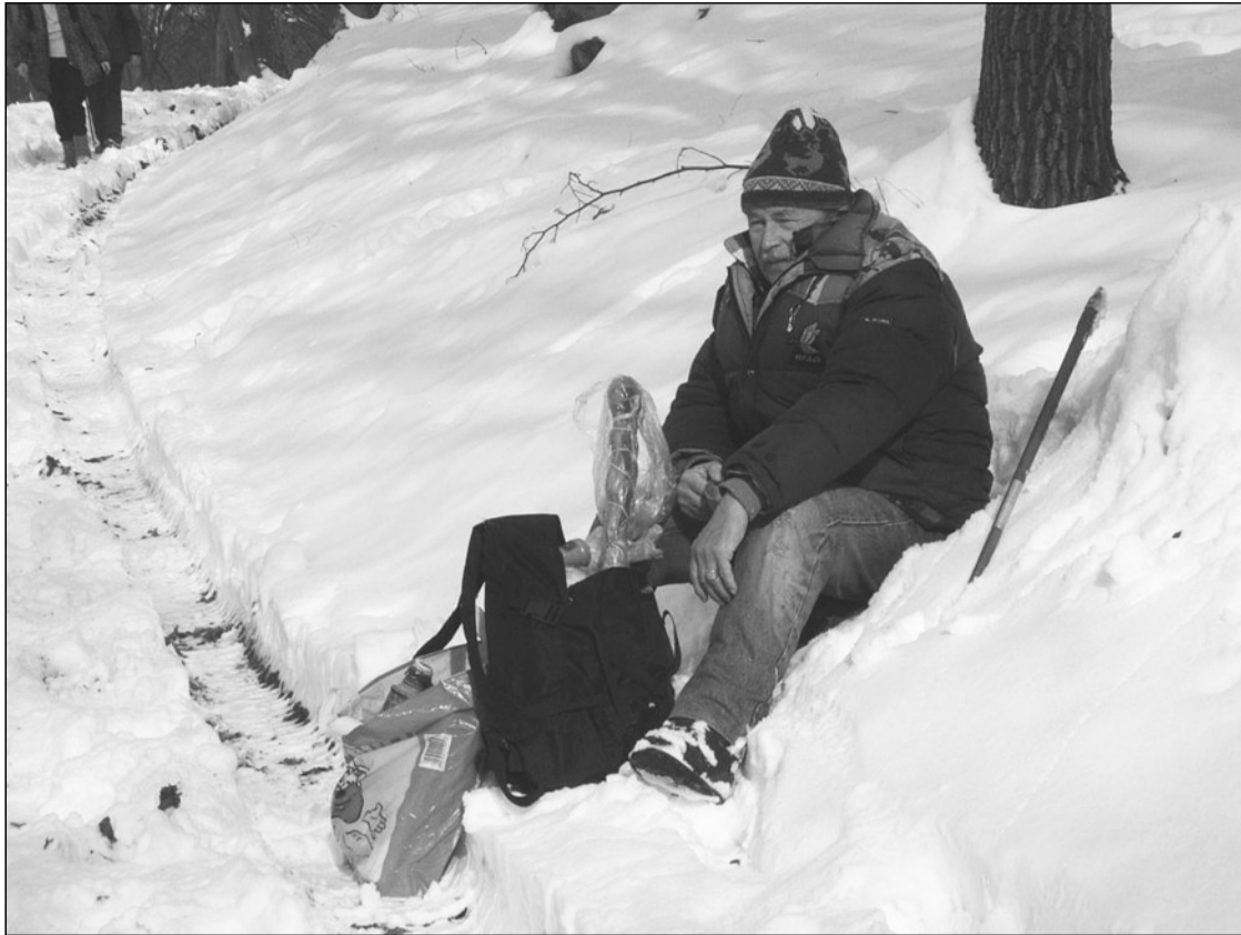
Télen-nyáron szervezte a túrákat érdekes ötletekkel (Fotó: 2009)