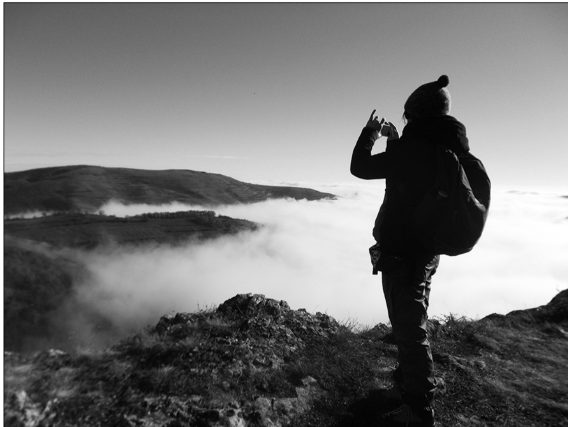
Köd előttünk, köd utánunk, köd felettünk, köd alattunk

ros sziklafalai között megrekedt köddel, mi a köd felett voltunk. Délnyugat irányban magas, piramis alakú csúcs emelkedett ki a hegygerincek felé, a Pilis (vf. Pleşii) 1250 m magas csúcsa. Tovább haladtunk előre fák, bokrok között, míg elértük a Rákos-csúcsot. A Kőközi-szorosban a szél játékosan tologatta a ködfoszlányokat, fel-felvilant egy részlet, látszott a kacsaringózó patak, a Lovagtemplom (Templul Cavalerilor) panzió középkori várra emlékeztető épülete, a szemközti oldal sziklafalai és kilátói. Fölöttünk az eget fátyolfelhők borították, Nagenyed felé vastag köd fedte a tájat, de a köd felett, valahol messze délen a Fogarasi-havasok hóborította csúcsai felerlettek.