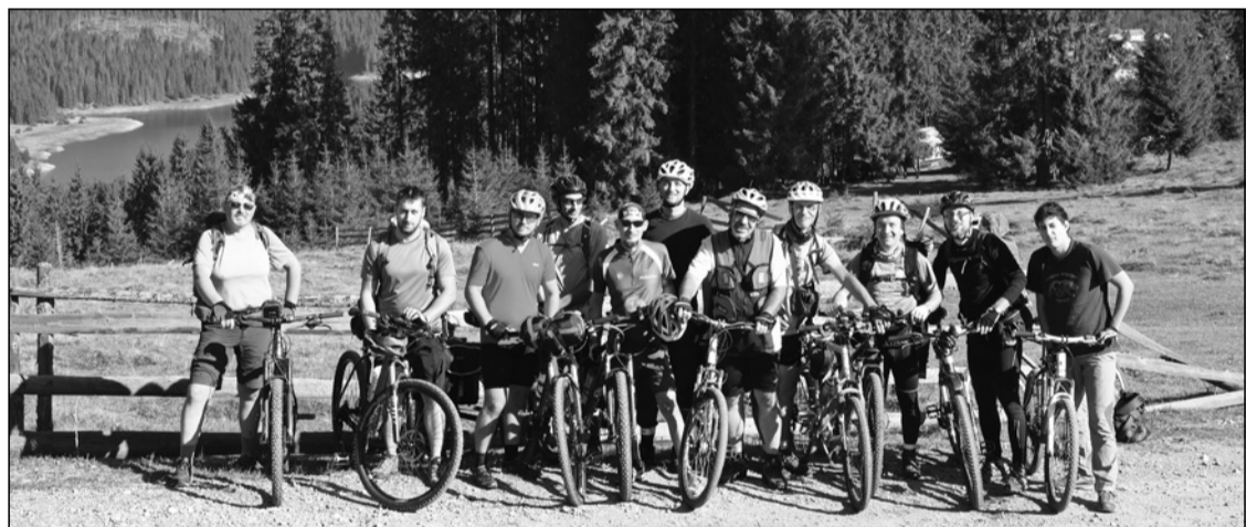
A jósikafalvi (Belis) tó Felsőgyurkucáról nézve

Az autós társaság reggeli után, hazaindulás előtt gombászni indult, és az előző napi záporoknak is köszönhetően bőséges zsákmánnyal tért haza.