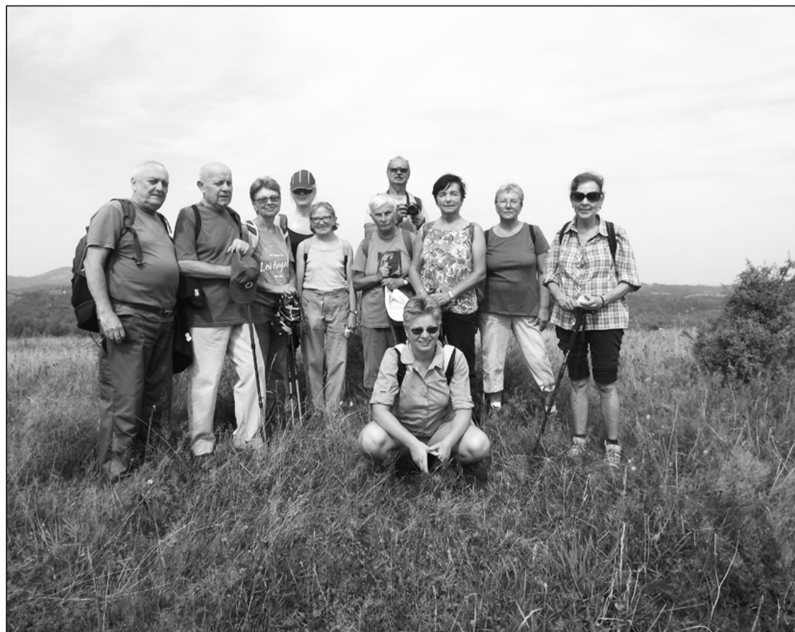
Csoportkép a Hârșu-tetőn

A vonat indulásáig még van egy kis idő, elsétálunk a Sebes-Körös partján egy nagyobb tisztásig, amit a helybeliek „futballpályának” neveznek, délután 17.15-kor érkezik a vonatunk, és visszautazunk Kolozsvárra.