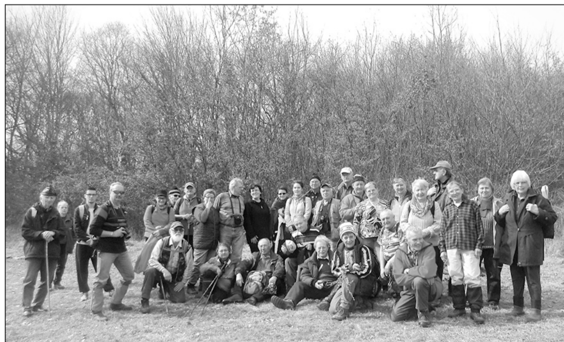
35-ön mentünk a szászfenesi Bükk-tetőre, alig fértünk fel a buszra

Március első hétvégéjén már nagyon vágytunk egy tavaszi kirándulásra. A szászfenesi Bükk-tetőre és a Szaniszló-völgyben jártunk. 35-ön voltunk, alig fértünk fel az M21-es szászfenesi autóbusszra. Az erdő kopár volt, a rügyek még nem mozdultak, csak itt-ott láttunk egy-egy májvirágot kék szirmaival kikandikálni a száraz avar között. A vidám madárcsicsergés elárulta, hogy a madarak is tudják: közeledik a tavasz. Jólesett kint lenni a természetben, nem fáztunk, nem volt már hideg, jó volt érezni a nap melegét. Az idén későbbre ébrednek a természet, de a városban, a kertekben már kivirágzott, helyenként elvirágzott a hóvirág és a száratlan kankalin. Az erdőben zordabb az időjárás, itt még várni kell a kora tavaszi virágokra, de az enyhe idő és egy kis eső megtette a magáét. A következő héten már a Gorbó-völgy oldalában sárgán virított a kivirágzott som, az Ördög-fák tisztását elborította a sok fehér hóvirág és a kétlevelű csilla, lépni is alig mertünk, nehogy eltapossuk őket.